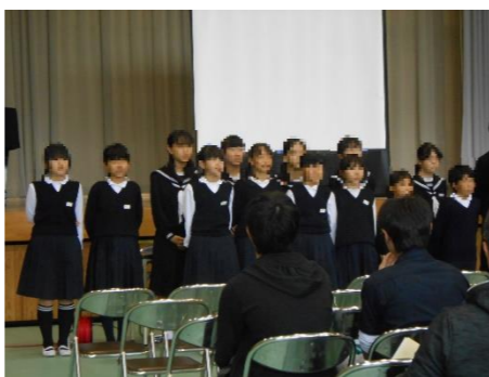
中学校との合同合唱「ふるさと」