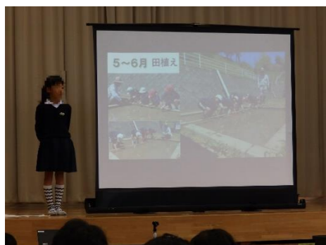
5年「おいしいお米が出来るまで」