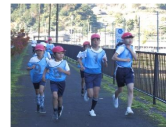
3. 2 km