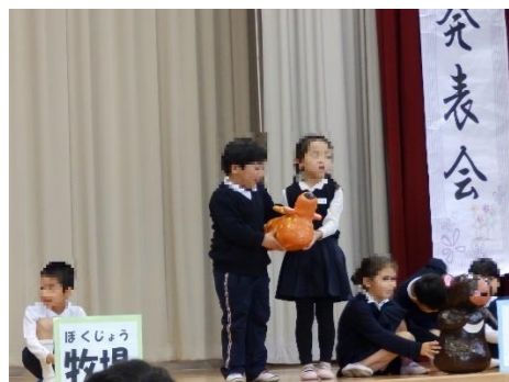
1・2年「いきてるってどういうこと」

今年度のオープンスクールは、小学校・中学校が同じ校舎で生活することになり合同で実施しました。午前中は小学生の「学習発表会」、午後からは小学校高学年と中学生合同の「ふるさと」の合唱に始まり、美術科とふるさと学習（総合学習）の発表がありました。