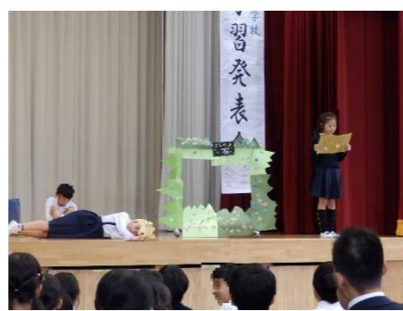
4年「美しい自然をいつまでも」