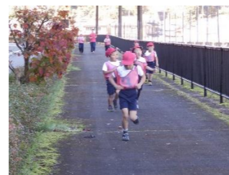
1. 5 km

好天の中、マラソン大会が行われました。子ども達は、学年や個人の体力に合わせ、1.5km・2.4km・3.2kmの3コースを選び走りました。曾爾のきれいな景色の中を最後まで頑張って走りました。最後に、3つのコースの男女別の1位の人に保健スポーツ委員会から表彰状が渡されました。保護者の方のたくさんの応援ありがとうございました。