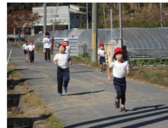
2. 4 km